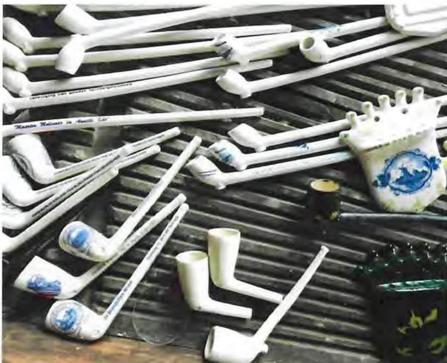
Een deel van het assortiment van de Goudsche pijpen-makerij "De Witte Kees"

naam of tekst kan worden aangebracht. De verpakking bestaat uit een kunststof kokerverpakking, voorzien van productinformatie in vier talen of eventueel een eigen tekst.